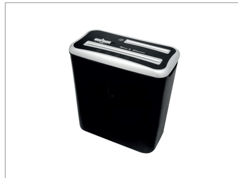
Skartovací stroj Wallner XD 805CD