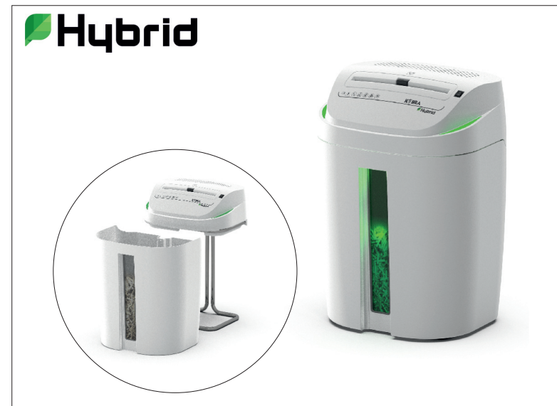
Skartovací stroje KOBRA S6/S4 Hybrid KOBRA C4 Hybrid