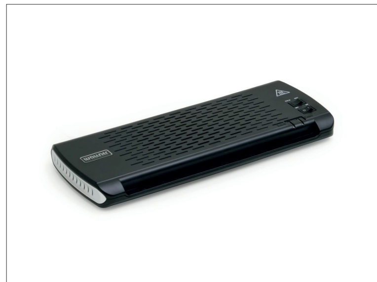
Laminátor Wallner OL 290